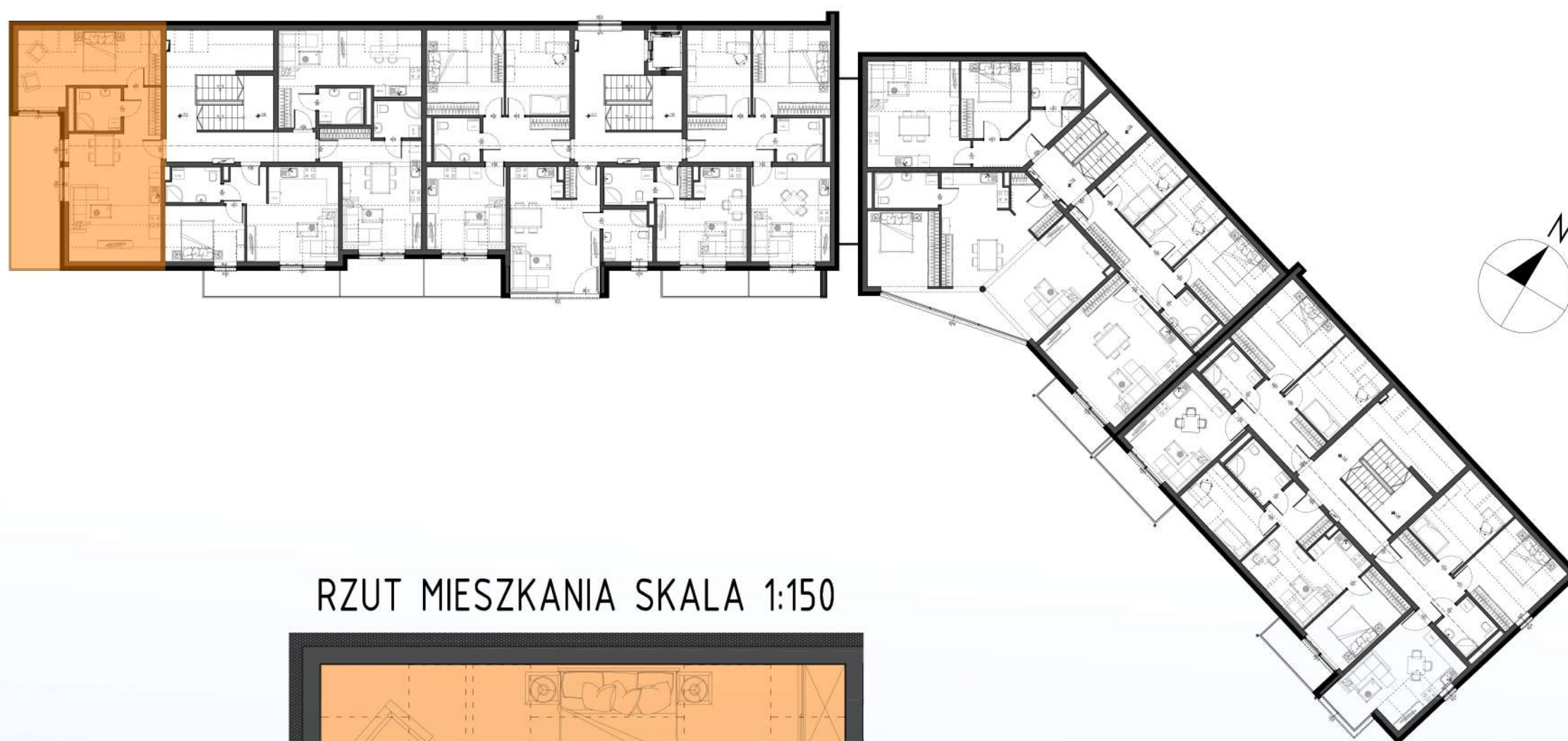
RZUT MIESZKANIA SKALA 1:150