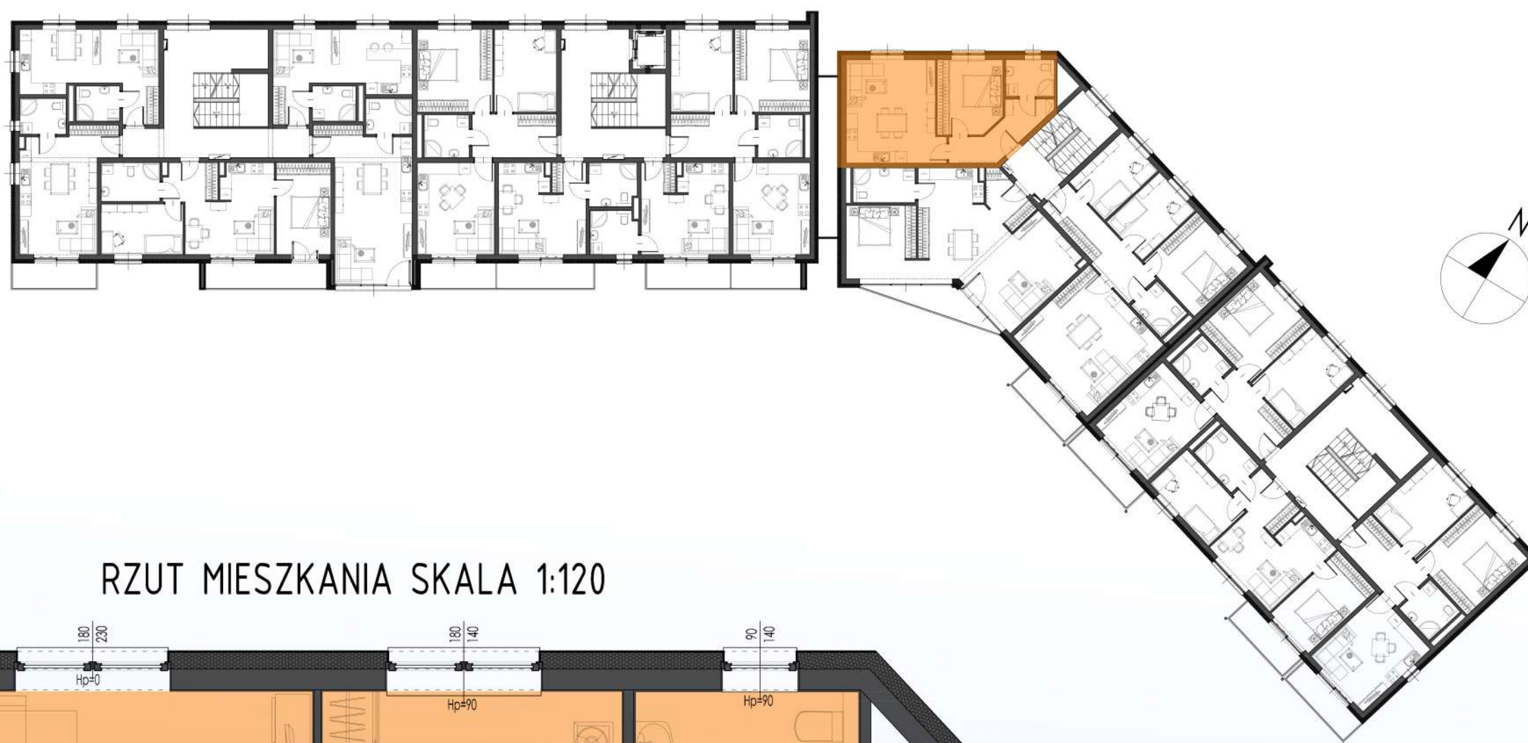
RZUT MIESZKANIA SKALA 1:120