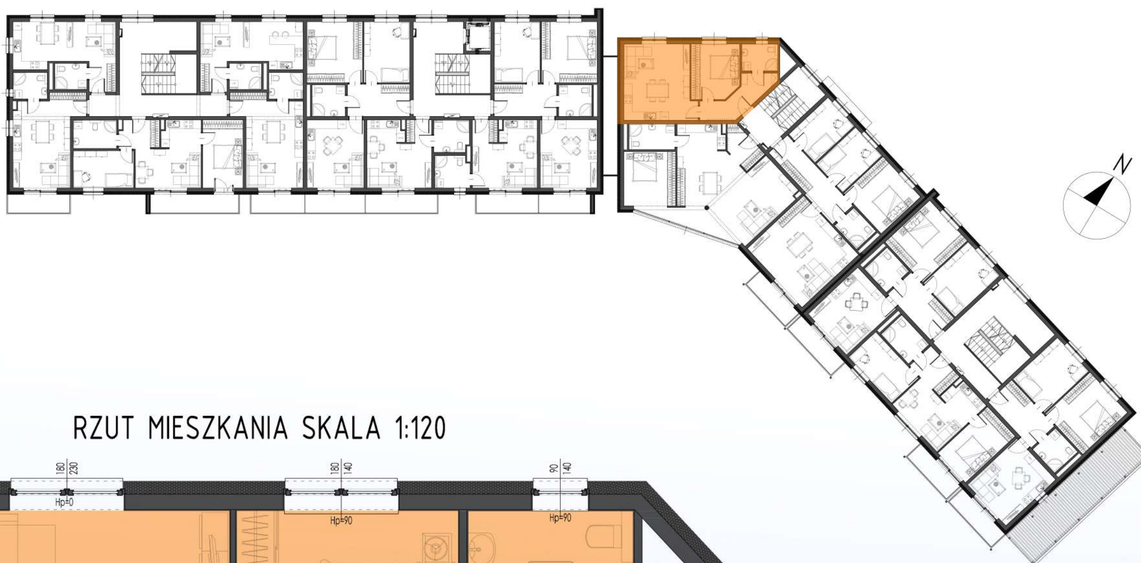
RZUT MIESZKANIA SKALA 1:120