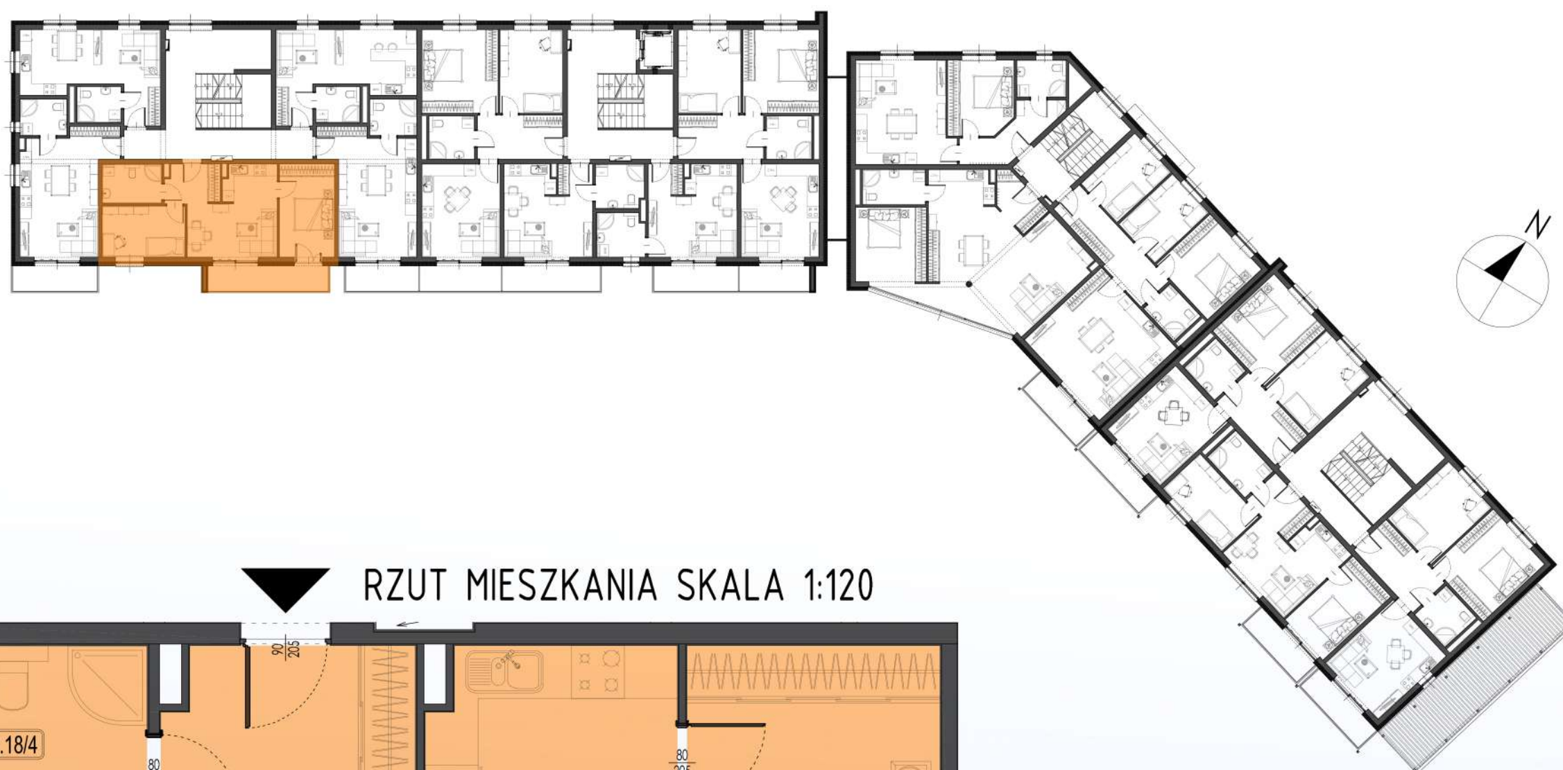
RZUT MIESZKANIA SKALA 1:120