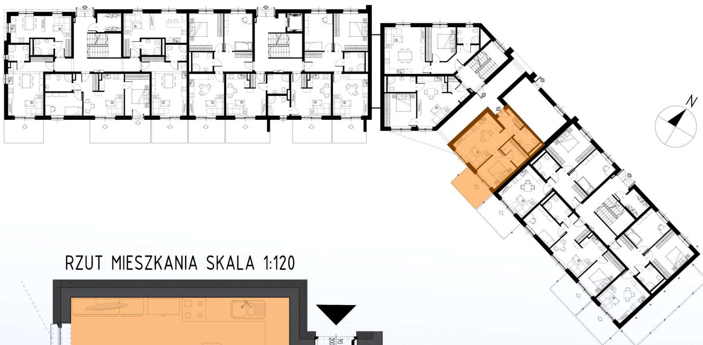
RZUT MIESZKANIA SKALA 1:120