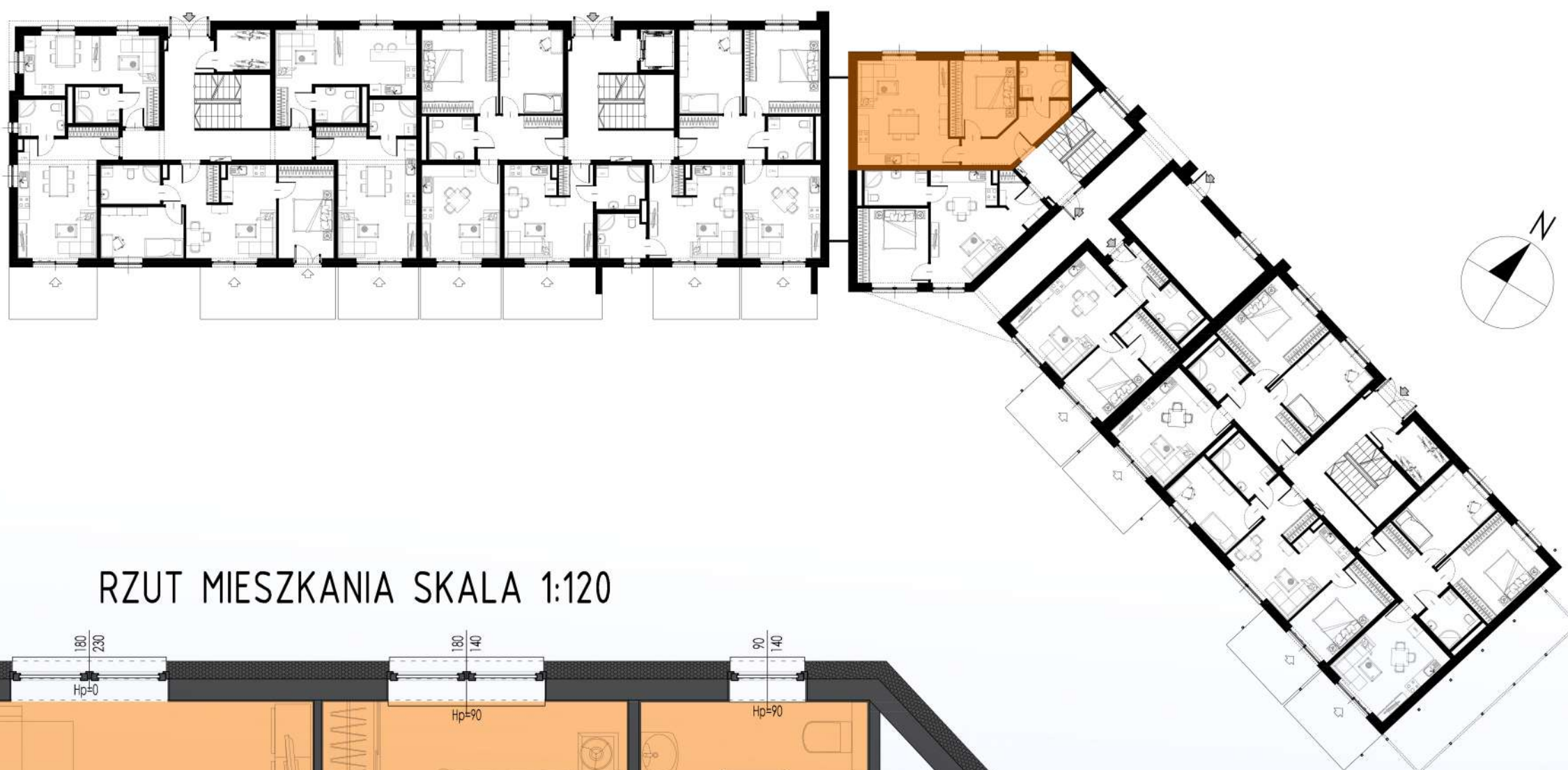
RZUT MIESZKANIA SKALA 1:120