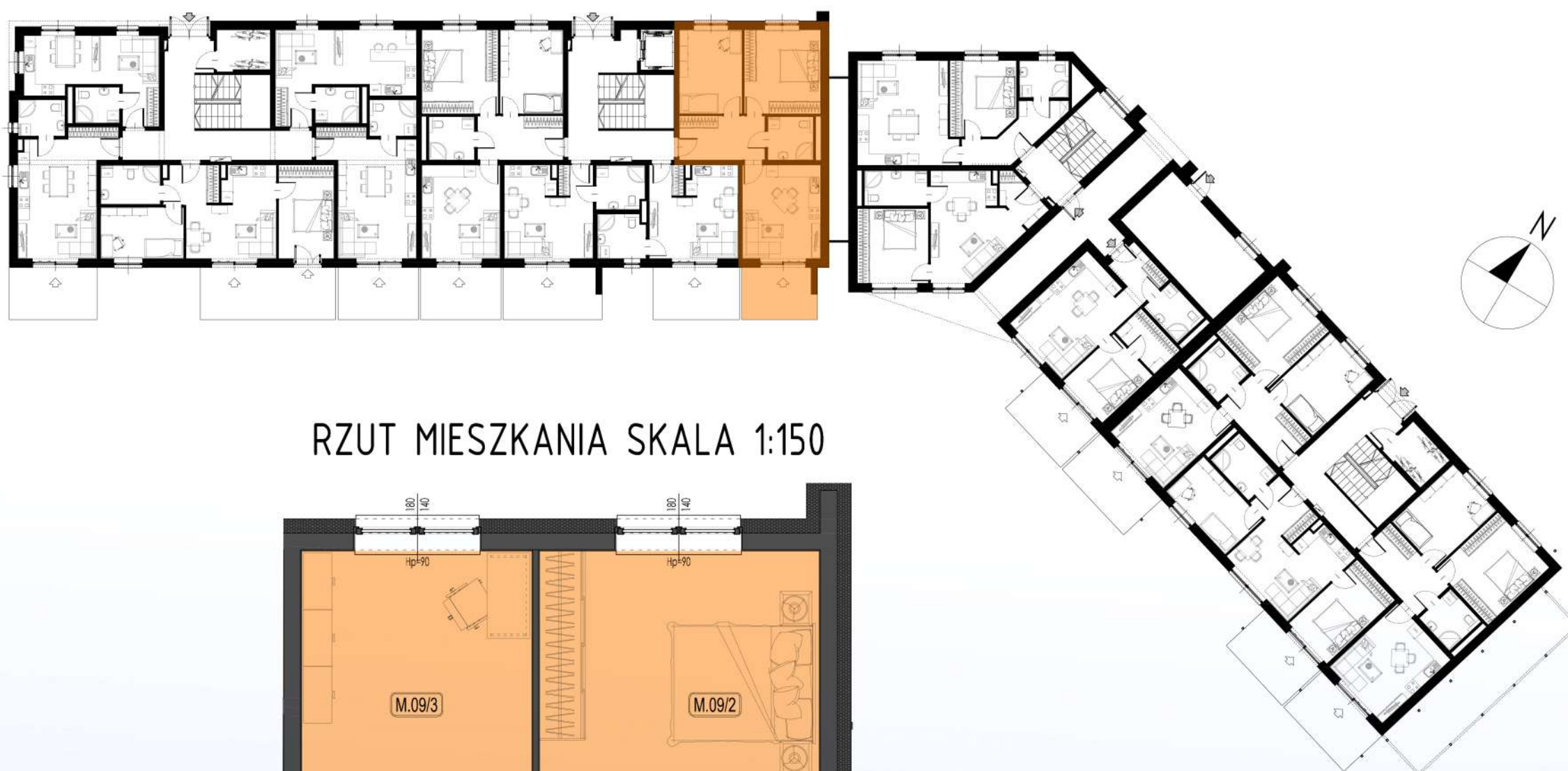
RZUT MIESZKANIA SKALA 1:150