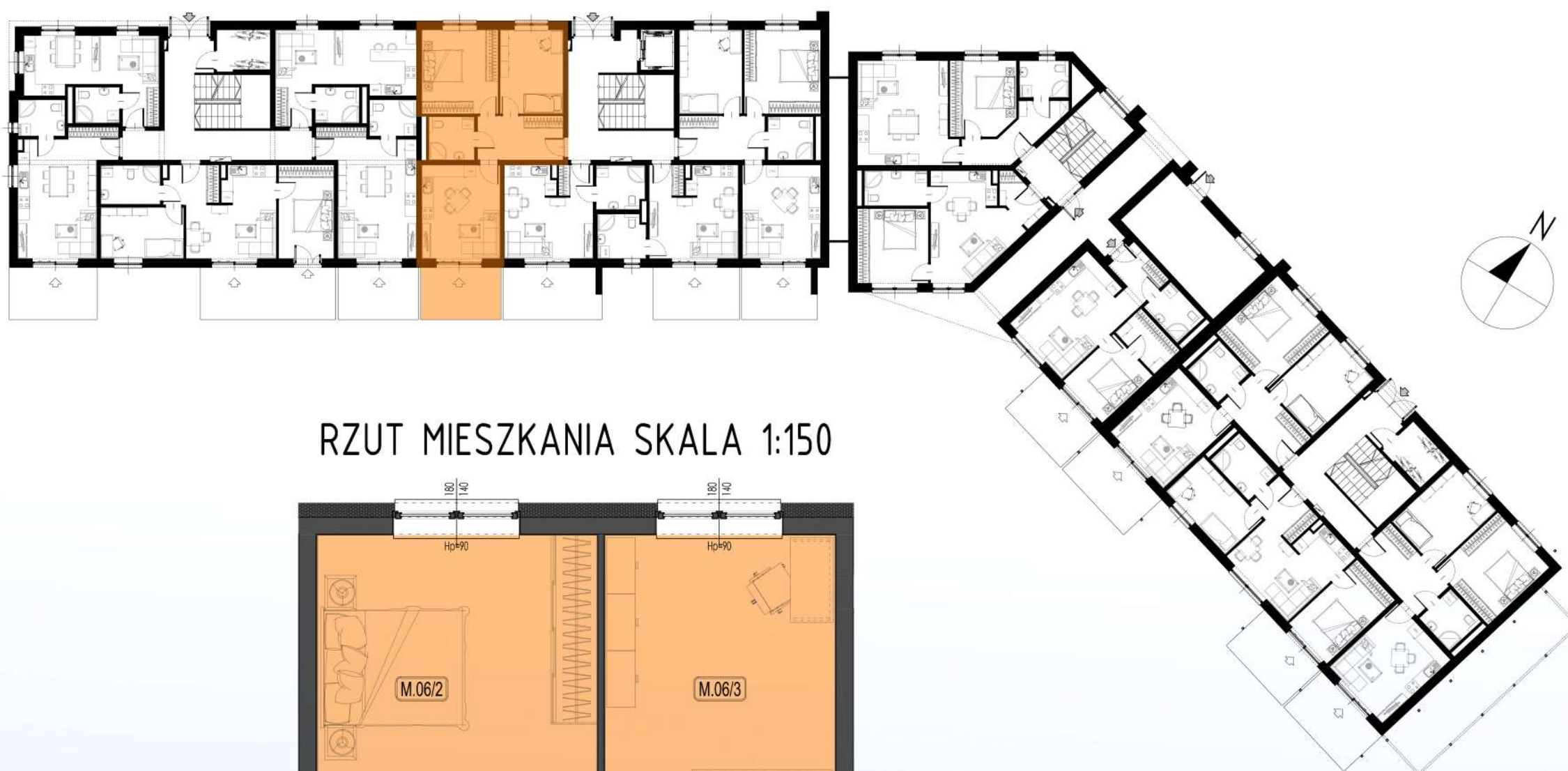
RZUT MIESZKANIA SKALA 1:150