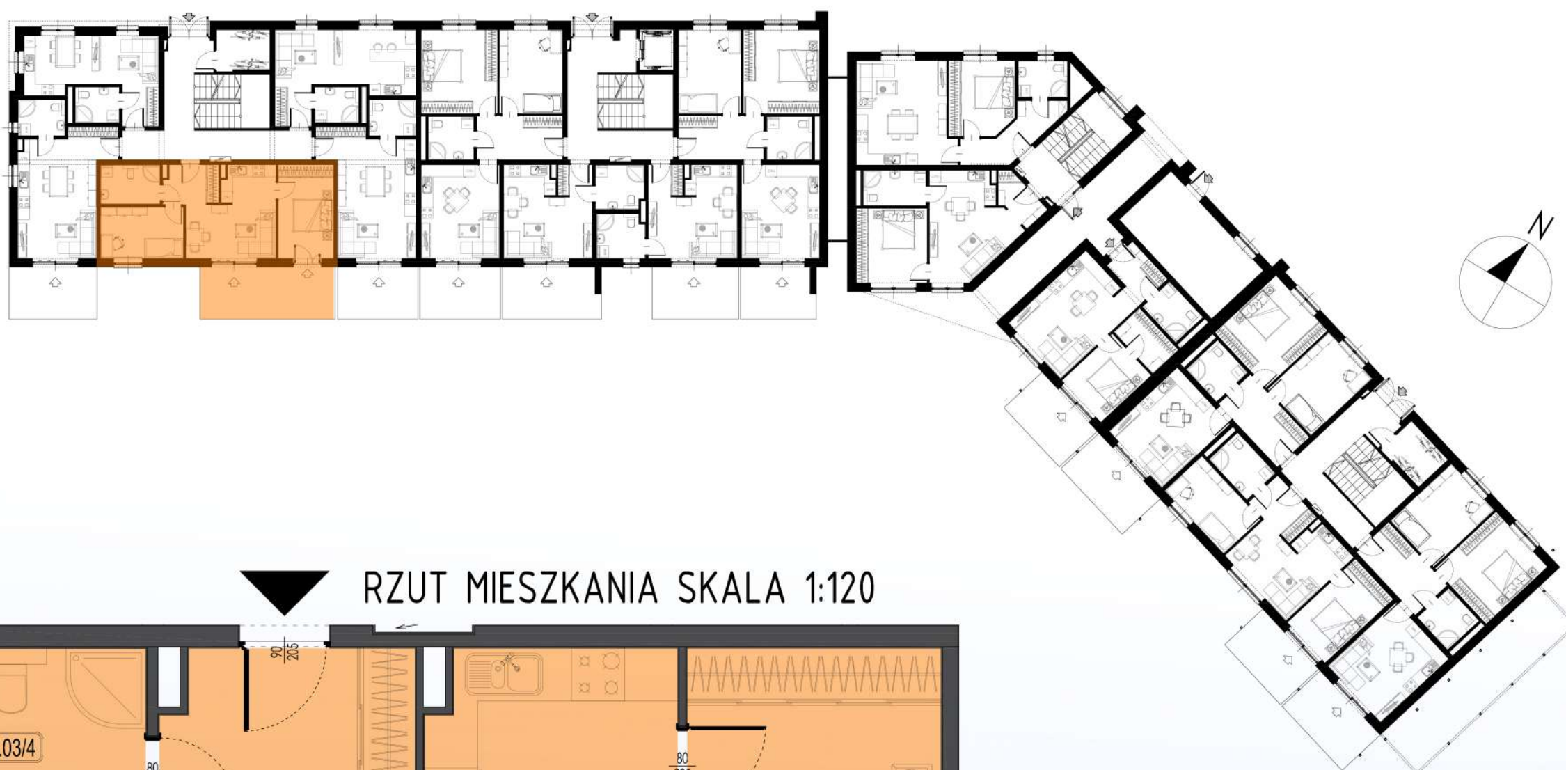
RZUT MIESZKANIA SKALA 1:120